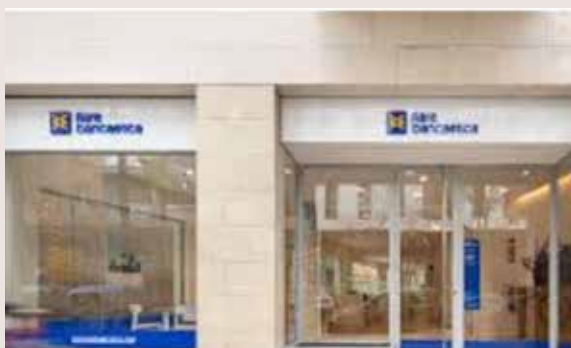
Fiare Banca Ètica