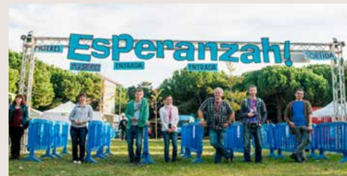
Cooperativa Festival Esperanzah!